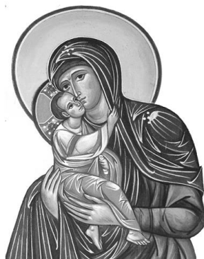
Mit Maria auf dem Weg

Die Sternsingerkinder besuchen die Familien am FREITAG, 02. Jänner. Ein herzliches Vergelts Gott den Betrieben, die die Sternsinger zum Mittagessen aufnehmen!